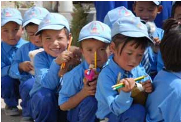
Kinderen voor kinderen – kunst voor kids

hen op zijn plaats. Maar wij danken uiteraard ook alle bezoekers. Namens B.Connected en de kinderen van de RIGLAM-school in India, heel erg bedankt.