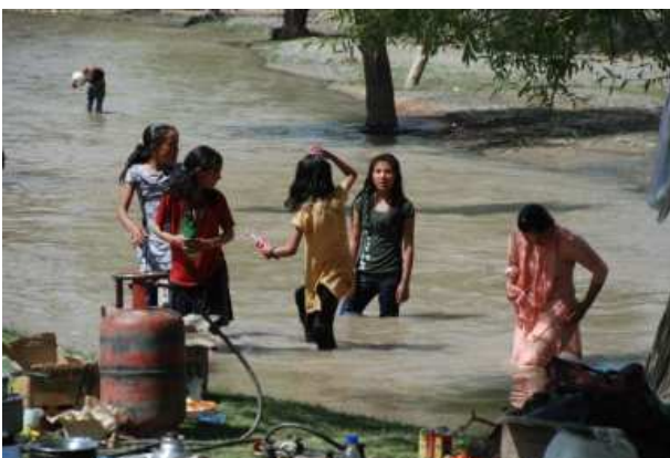
Kinderen en leerkrachten in het water.

De tweede week stond in het teken van de picknick en de parentsday. Twee belangrijke gebeurtenissen in het schooljaar. De picknick is voor de kinderen hét uitje. Iedereen verheugt zich weer op dit spektakel. Dit jaar was het op een grote picknickplaats bij Shey. Door het mooie weer was er voldoende water in de beken om er weer een groot waterballet van te maken. Onder aanvoering van Peter was er geen enkele plek veilig.